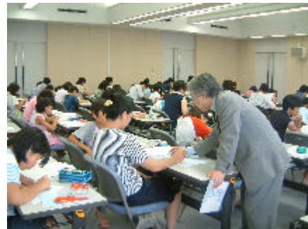
平成15年度の開催風景

県庁統計課(企画普及グループ) 〒371-8570 前橋市大手町1-1-1 電 話 : 027-226-2402 F A X : 027-224-9224