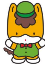
群馬県のマスコット 「ぐんまちゃん」