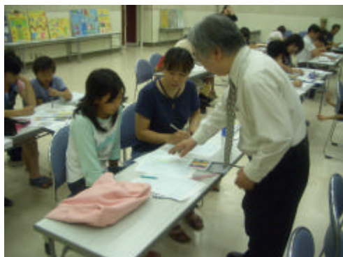
平成17年度の開催風景