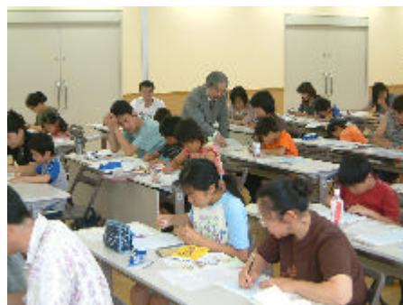
平成16年度の開催風景

県庁統計課企画普及グループ 〒371-8570 前橋市大手町1-1-1 電 話：027-226-2402 F A X：027-224-9224