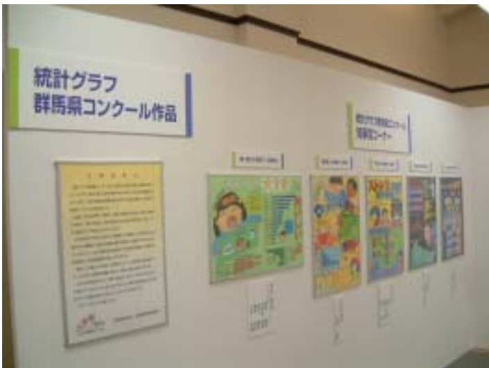
平成15年の展示会場・知事賞コーナー

K課長 はい、それにはまず、「統計グラフ群馬県コンクール」についてお話ししましょう。このコンクールは、県民のみなさんに統計に親しんでいただくとともに、統計の表現技術を磨いていただける機会を提供しようと、昭和30年度から毎年開催しているものなんです。コンクールは小学生を2学年毎に区分した第1部第2部、第3部、中学生の第4部、高校生以上の生徒・学生及び一般を対象とした第5部、そしてパソコン統計グラフの部から成っています。作品のテーマは各部とも自由ですが、小学校1年生から4年生は、自分達で観察や調査した結果を、また、それ以外は、各種の統計資料から得られるデータの使用も可能で、それらを統計グラフにまとめてB2サイズの画