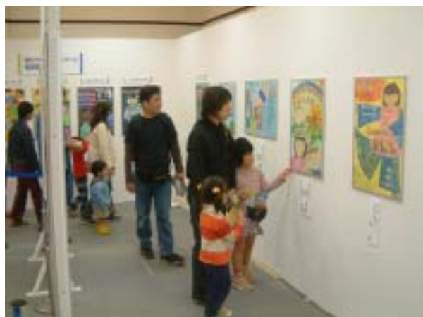
平成 15 年の作品展示会場

これらの作品を多くの県民の方々に見ていただくことにより、統計とは何か、統計が私たちの生活にどんな関わりを持っているかを御理解いただき、統計に興味と親しみを持っていただければと考えています。