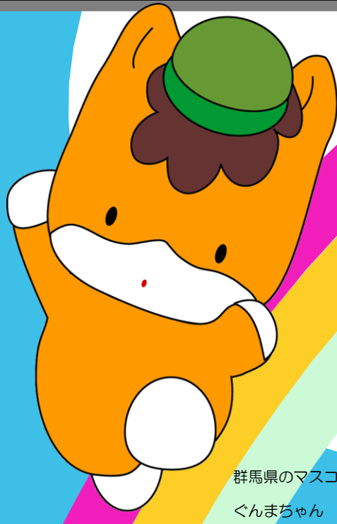
群馬県のマスコットキャラクター ぐんまちゃん